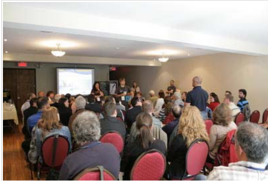
Le Forum régional sur les lacs a démontré l'importance de la mobilisation citoyenne pour le suivi de l'état de santé des lacs.

FRÉDÉRIQUE DAVID, COLLABORATION SPÉCIALE Environnement - Publié le 19 juillet 2010 à 09:11