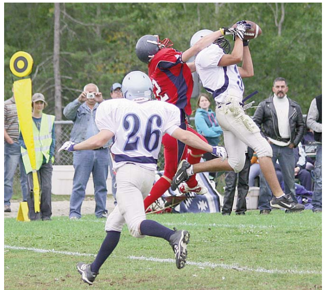
Le Sommet commence à pouvoir miser un peu plus sur la passe. C'est bon signe!